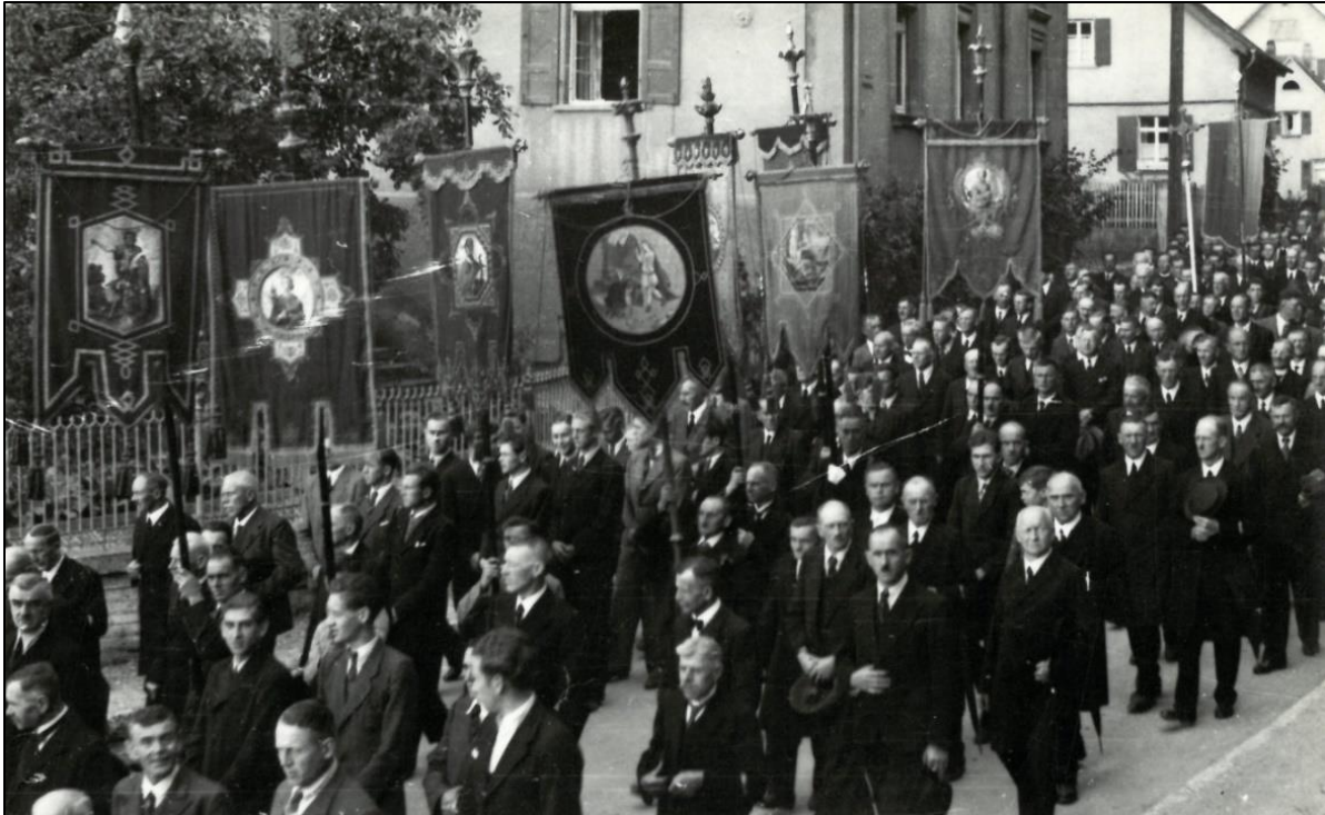
Nach dem Ende der NS-Diktatur können auch die kirchlichen Feste wieder traditionsgemäß gefeiert werden: Fronleichnamprozession 1946. Manche, die im Dritten Reich der NS-Ideologie gefolgt und aus der Kirche ausgetreten sind, treten jetzt wieder ein. 79

So geschieht es denn auch. Die Spruchkammern heben nach und nach praktisch alle früheren Säuberungsbescheide auf und entwickeln sich schnell zu „Mitläuferfabriken“. 80 Gesäubert werden jetzt nicht mehr Staat und Gesellschaft von den Nationalsozialisten, sondern vielmehr die ehemaligen Nationalsozialisten von jeglicher individuellen Schuld und Verantwortung. In den ausstehenden Verfahren dürfen sie ihre vollständige Rehabilitierung erwarten: „Als große Nazi fahren sie nach Tübingen“, so gibt der dortige Säuberungskommissar einen gängigen Spruch wieder, „und als kleine kommen sie heim.“ 81