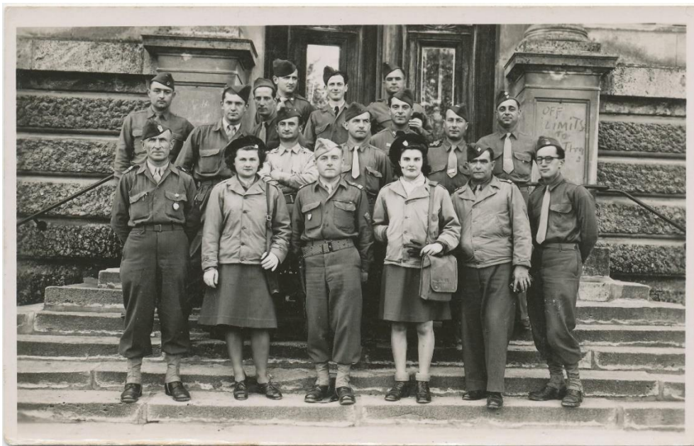
Nach dem Zusammenbruch des NS-Regimes haben die französischen Besatzer (hier vor dem Ehinger Gymnasium) das Sagen. Die Entnazifizierung führen die Deutschen jedoch weitgehend in eigener Regie durch.

In der französischen Zone, zu der auch Ehingen gehört, verläuft die Säuberung in den ersten Monaten nach Kriegsende unkoordiniert, je nach Gusto der örtlichen Militärkommandeure. In Ehingen werden einige NS-Funktionäre von der Besatzungsmacht verhaftet und teilweise jahrelang interniert. 2