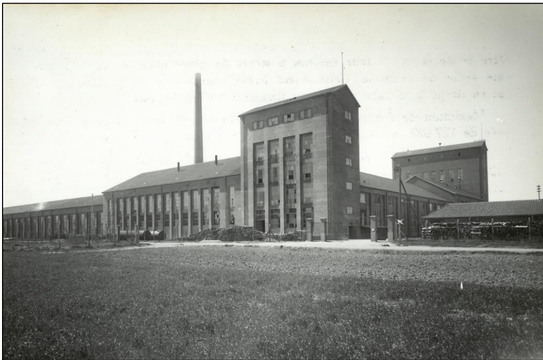
Die Schwäbischen Zellstoffwerke 1947 118